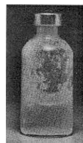
Fig. 3 - Não use este medicamento se partículas no fundo ou na parede derem ao frasco um aspecto fosco (embaçado).

Uso de seringa adequada: As doses de insulina são medidas em unidades . O número de unidades em cada mililitro (mL) está claramente impresso na embalagem. Cada tipo de insulina está disponível na concentração de 100 unidades/mL. É importante entender as graduações na seringa porque o volume a ser injetado depende da concentração, que é o número de unidades por ml. Por esta razão, deve-se utilizar sempre uma seringa graduada para a concentração de insulina. Erro no uso da seringa pode levar a um erro na dose, causando sérios problemas, como variação na glicemia (taxa de glicose no sangue) que pode ser muito baixa ou muito alta.