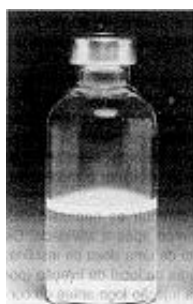
Fig. 1 - Não use este medicamento se o material permanecer no fundo do frasco após a agitação.

Verificar sempre o frasco de insulina antes de usar. Se você notar qualquer diferença na aparência ou alterações marcantes nas características da insulina, consulte o médico.