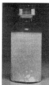
Fig. 2 - Não use este medicamento se houver grumos em suspensão (soltos) no líquido após a agitação.