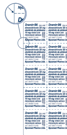
Blister da apresentação de 30 unidades