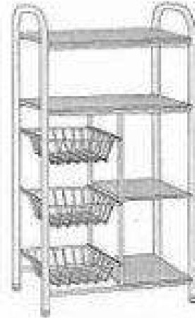
Fruteira REF 02

Fone/Fax:32 3578-1409 32 3578-1703 32 3578-1114 Rodovia Guidoal-Ubá KM 1,5 Sítio Boa Vista Bairro:Rodovia Guidoal-MG Cep:36515-000